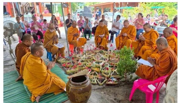
พิธีทำบุญกลางบ้าน บ้านหนองจอกน้อย