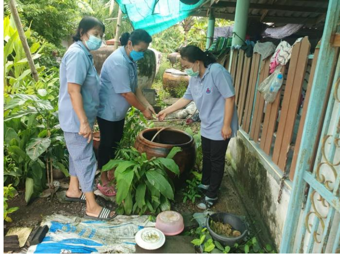
การใส่ทรายอะเบทลงในภาชนะใส่น้ำป้องกันการเกิดยุงลาย

นอกจากนี้บ้านหนองจอกน้อย ยังมีการส่งเสริมให้ประชาชนในหมู่บ้าน ตกแต่งบ้านให้ดูสวยงาม หน้าบ้าน-น่านอง ด้วยการปลูกผักสวนครัวรั้วกินได้ หรือปลูกไม้ดอก-ไม้ประดับ ตามความต้องการของครัวเรือนตนเอง