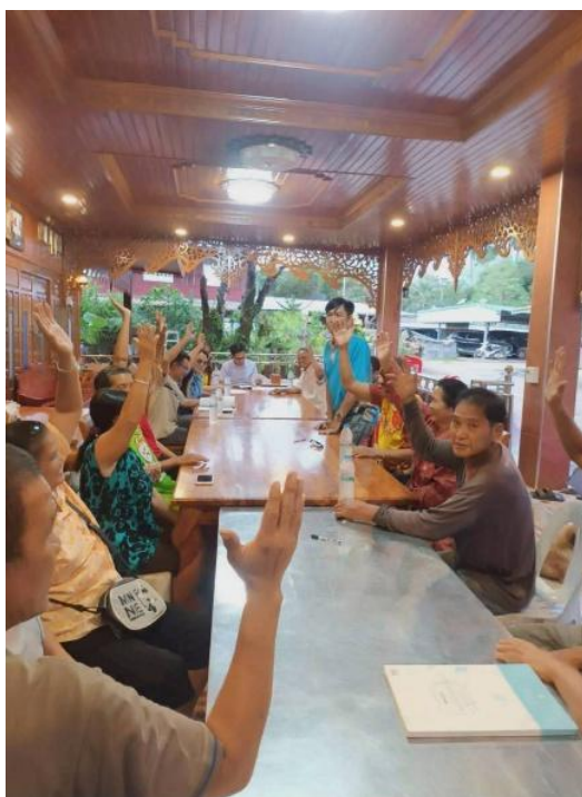
ภาพการประชุมหมู่บ้าน บ้านหนองจอกน้อย

จึงขอยกตัวอย่างการใช้เวทีประชาคมเพื่อพิจารณาการให้ความช่วยเหลือแก่ผู้ด้อยโอกาสในพื้นที่บ้านหนองจอกน้อย ทางคณะกรรมการหมู่บ้าน ได้ร่วมกันจัดเวทีประชาคมเพื่อร่วมลงมติรับรองการพิจารณาให้ความช่วยเหลือผู้ด้อยโอกาส ซึ่งการใช้การประชาคมนี้อาจจะทำให้ได้ข้อมูลที่ถูกต้อง เป็นความจริง และเป็นที่ยอมรับร่วมกันของคนในหมู่บ้าน