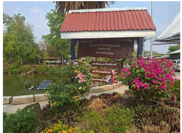
การดูแลรักษาความสะอาดบริเวณที่สาธารณะของหมู่บ้าน