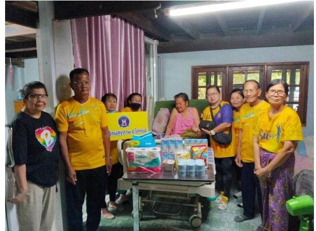
การมอบถุงยังชีพช่วยเหลือผู้สูงอายุ