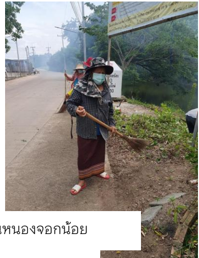
กิจกรรมจิตอาสาปรับปรุงภูมิทัศน์พื้นที่สาธารณะบ้านหนองจอกน้อย