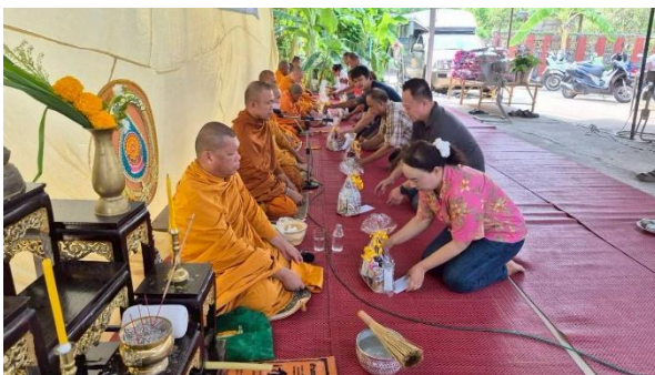
การทำบุญในวันสำคัญทางพุทธศาสนา

ประชาชนบ้านหนองจอกน้อย มีการปฏิบัติศาสนากิจอยู่เป็นประจำจนเป็นวิถี มีการทำบุญตักบาตรอยู่เป็นประจำจนเป็นกิจวัตรประจำวัน และหากมีกิจกรรมเนื่องในวันสำคัญทางพระพุทธศาสนา เช่น พิธีกวนข้าวหมูแดง การทำบุญกลางบ้าน ประชาชนบ้านหนองจอกน้อยก็จะมาร่วมกิจกรรมวันสำคัญทางศาสนาเป็นจำนวนมาก บ้างก็มาร่วมทำบุญ บ้างก็มาช่วยงานวัด แล้วแต่ความพร้อมและความสมัครใจของแต่ละคน