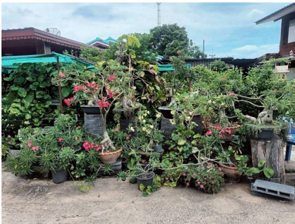
การตกแต่งบ้านด้วยพืชผักสวนครัว ไม้ดอกไม้

นอกจากนี้บ้านหนองจอกน้อย ยังมีการส่งเสริมให้ประชาชนในหมู่บ้าน ตกแต่งบ้านให้ดูสวยงาม หน้าบ้าน-น่านอง ด้วยการปลูกผักสวนครัวรั้วกินได้ หรือปลูกไม้ดอก-ไม้ประดับ ตามความต้องการของครัวเรือนตนเอง