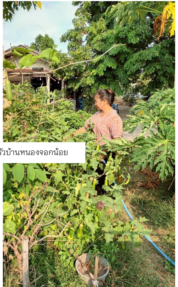
ครัวเรือนปลูกผักสวนครัวบ้านหนองจอกน้อย