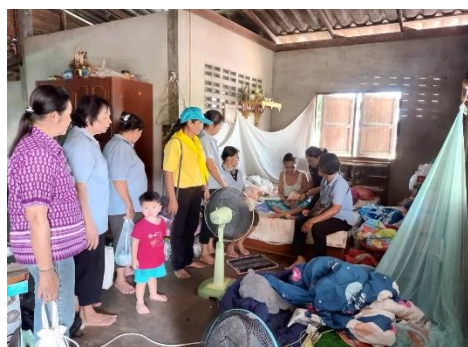
ภาพการมอบถุงยังชีพช่วยเหลือผู้ด้อยโอกาสในพื้นที่