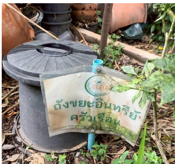
ตัวอย่างครัวเรือนมีถังขยะเปียกลดโลกร้อน

- เศษอาหาร/ผักสด/ผลไม้ หากมีอาหารที่บริโภคไม่หมด ครัวเรือนก็จะแยกอาหารไว้ นำไปเป็นอาหารหมู อาหารไก่และอาหารสุนัข ส่วนเศษผักผลไม้ก็จะนำไปทิ้งลงถังขยะเปียกลดโลกร้อนเพื่อหมักไว้เป็นปุ๋ยบำรุงดินในครัวเรือน