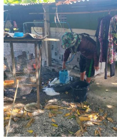
การประหยัดน้ำโดยใช้น้ำสุดท้ายจากการซักผ้ามารดน้ำผัก